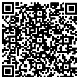
QR Code ๑ ยืนยันการเข้าร่วมประชุม