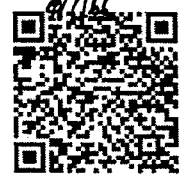
การรายงานผล